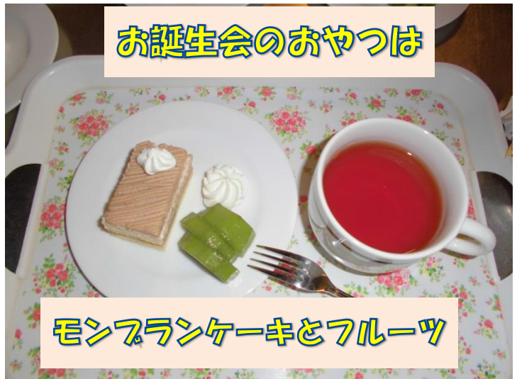
お誕生会のおやつは