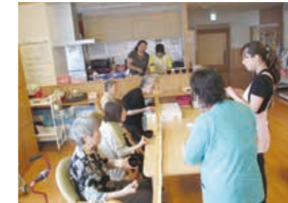
レクリエーション (流しそうめん)