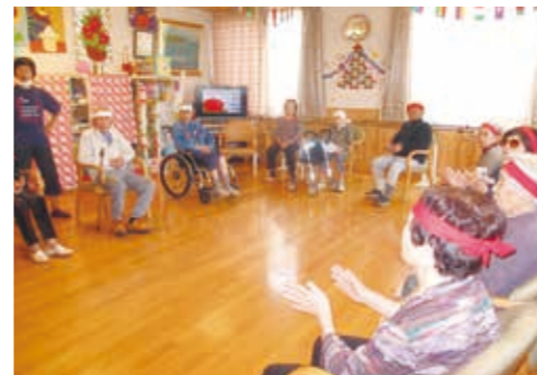
レクリエーション (運動会)