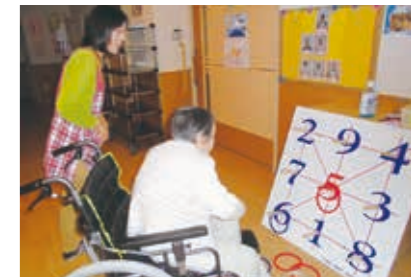
レクリエーション (輪投げ)