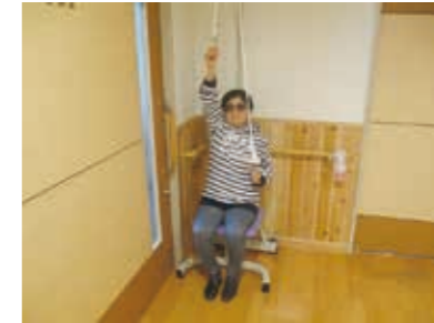
機能訓練風景 (プーリー)