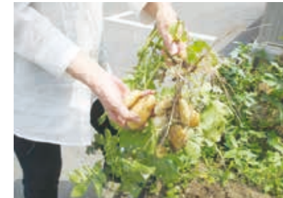
園芸活動 (じゃがいも掘り)