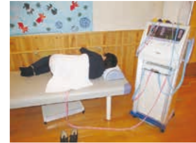
機能訓練風景 (低周波)