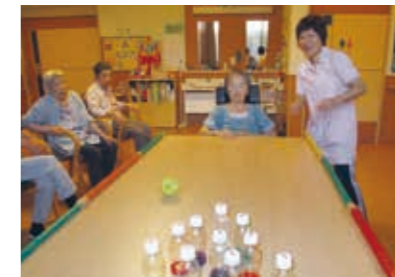
レクリエーション (ボーリング)