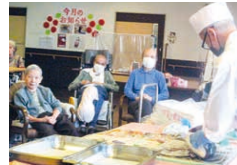
まぐろ解体ショー