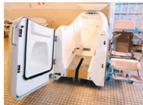
ユニット用バブル式車イス浴槽